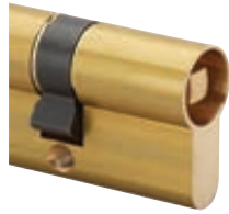
Carré mâle intérieur