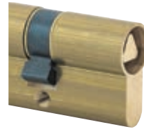
Triangle intérieur ( \Delta 9 uniquement)