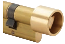
Triangle protégé (11 ou 14)