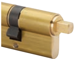
Carré mâle dépassant